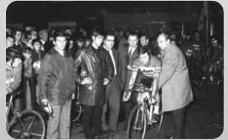
Gentlemenkoers tijdens 'Zedelgem-dorp-kermis', 1970