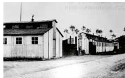
Legerbarakken statie

De militaire aanwezigheid startte in 1914 met de Duitse bezetting. Het is nu 16 jaar geleden dat na de zomer van 2007 de Koninklijke School voor Onderofficieren Nr. 2 de deuren sloot. Wil je meer weten over hoe het depot, de kazerne en de andere gebouwen tot stand zijn gekomen en de bijna 100 jaar militaire aanwezigheid is verlopen? Kom dan naar deze interessante lezing. Wie weet kun je nadien zelf nog heel wat feiten aanvullen met eigen ervaringen of gehoorde verhalen.