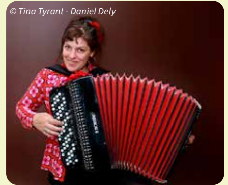
© Tina Tyrant - Daniel Dely