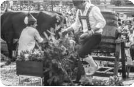
Tirolerstoet tijdens de Batjes, 1983