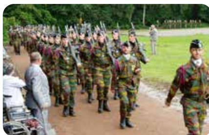
Defilé tijdens de laatste proclamatie in de Koninklijke School voor Onderofficieren in Zedelgem, 2007

Heb je zelf nog foto's die Roger maakte of help je graag met het gedetailleerd beschrijven van de beelden? Laat het zeker weten en mail naar archieff@zedelgem.be of bel 050 814 414