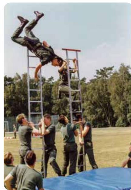
Demonstratie tijdens schoolfeest op 26 juli 1990