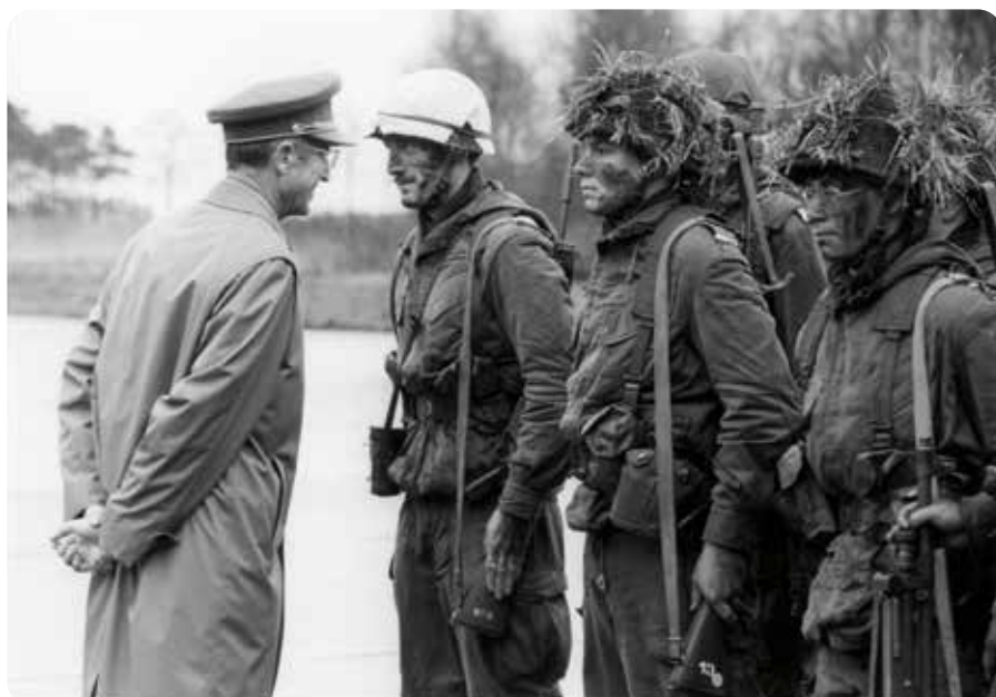
Demonstratie van tactiek tijdens bezoek van Koning Boudewijn aan de school in 1986

Benieuwd wat er zich nog allemaal in de collectie bevindt of zin om mee te werken? Stuur een mailtje naar archieff@zedelgem.be