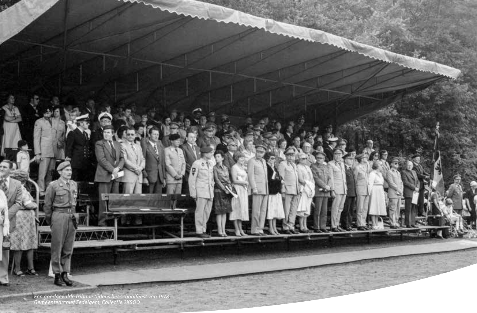
Een goedgevulde tribune tijdens het schoolfeest van 1978