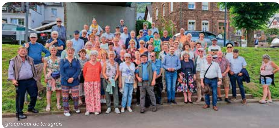
groep voor de terugreis