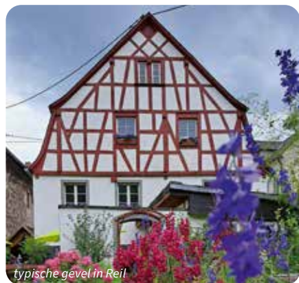
typische gevel in Reil