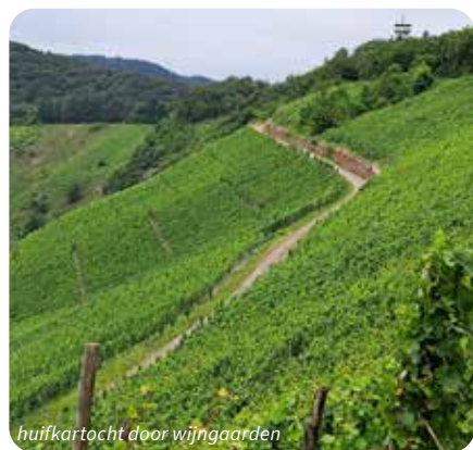
huifkartocht door wijngaarden

Neem voor meer info gerust contact op. E-mail: jumelagezedelgem@gmail.com of toerisme@zedelgem.be - www.zedelgem.be/jumelage-met-het-duitse-reil