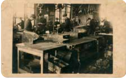
Zicht op de werkplaats bij de Werkhuizen Gebroeders Claeys

Schreef jij Open Monumentendag al in je agenda? In het weekend van 7 en 8 september 2024 halen we met een rijkelijk gevuld programma herinneringen op aan de bekende Zedelgemse rijwielfabrikanten Flandria en Superia.