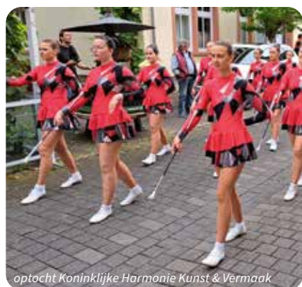
optocht Koninklijke Harmonie Kunst & Vermaak