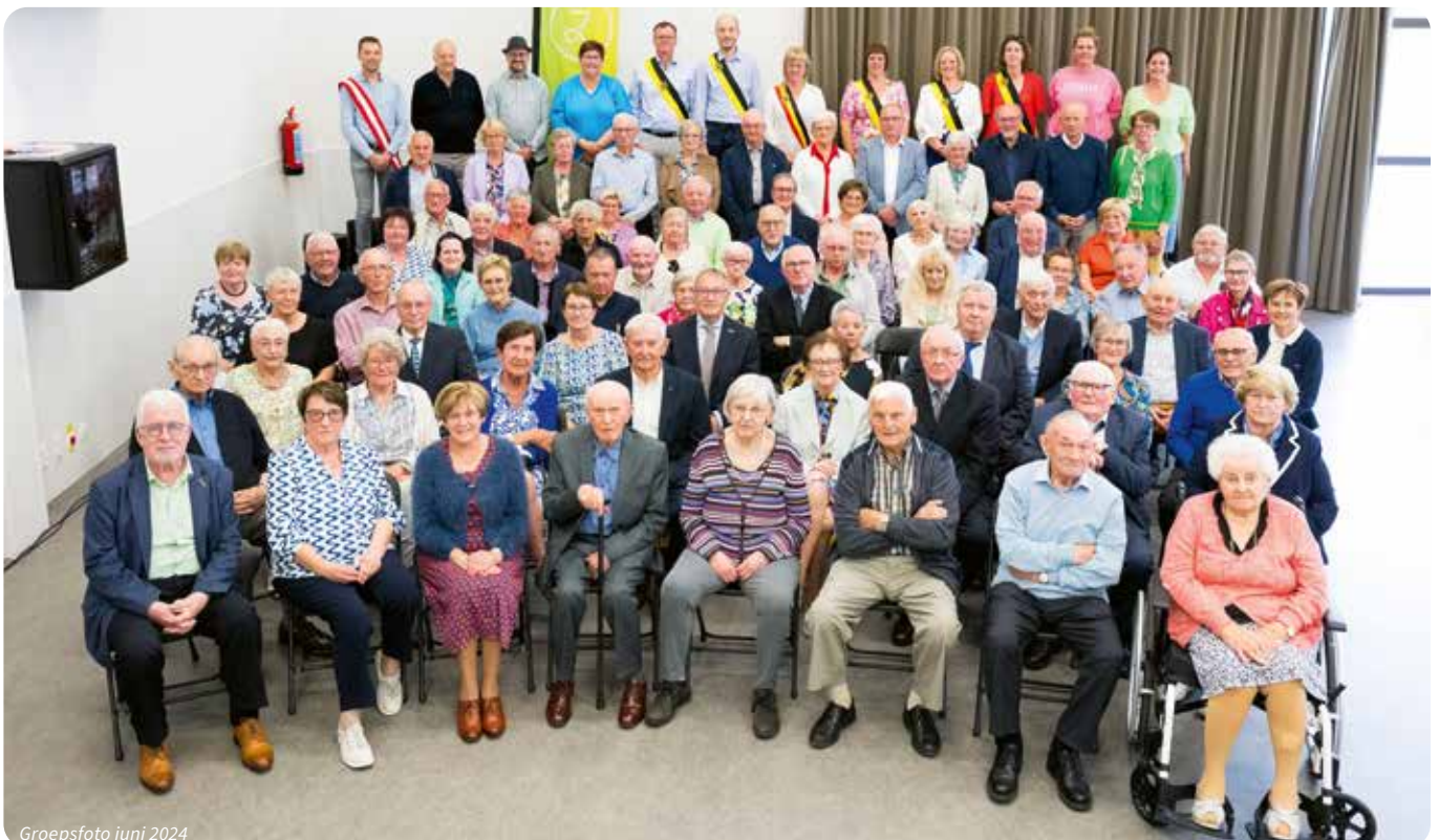
Groepsfoto juni 2024

tot en met juni. Het tweede feest gaat door in november.