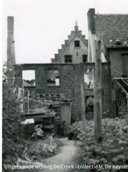
Uitgebrande woning De Crock