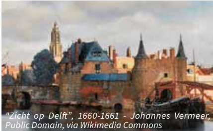
"Zicht op Delft", 1660-1661 - Johannes Vermeer