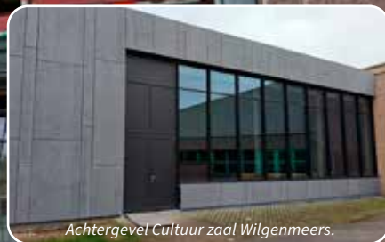
Achtergevel Cultuur zaal Wilgenmeers.