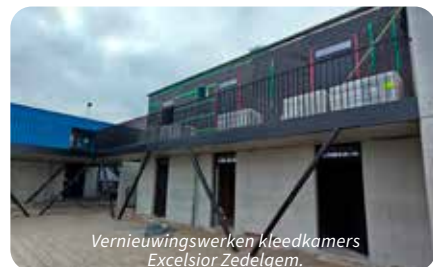
Vernieuwingswerken kleedkamers Excelsior Zedelgem.

Contact sportdienst: mail naar groenemeersen@zedelgem.be of bel 050 288 330.