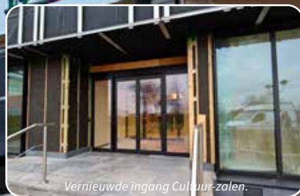
Vernieuwde ingang Cultuur-zalen.