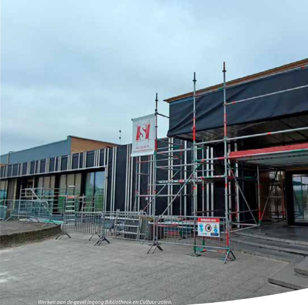
Werken aan de gevel ingang Bibliotheek en Cultuur-zalen.