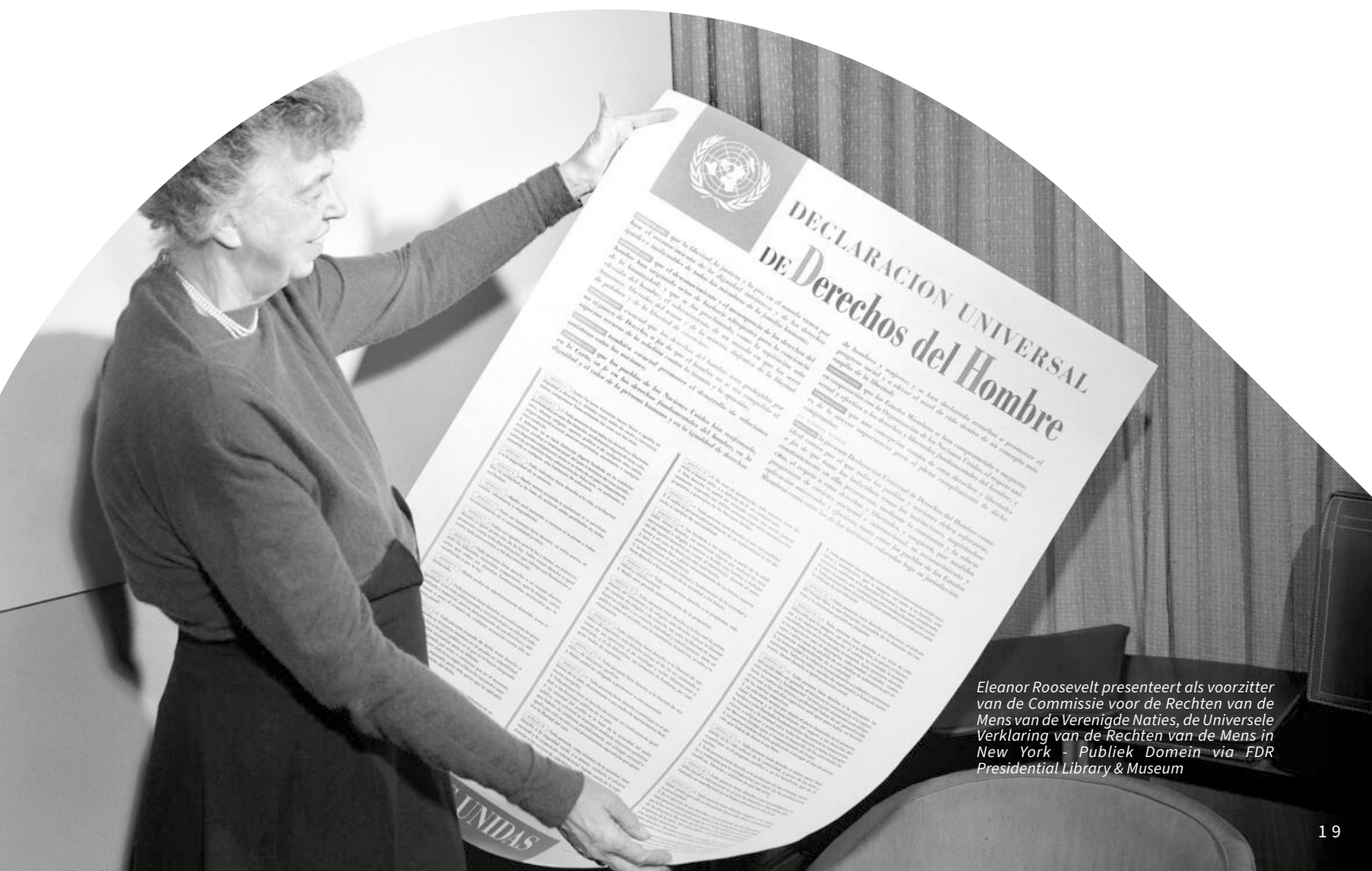
Eleanor Roosevelt presenteert als voorzitter van de Commissie voor de Rechten van de Mens van de Verenigde Naties, de Universele Verklaring van de Rechten van de Mens in New York