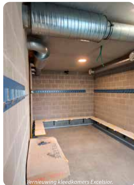
Vernieuwing kleedkamers Excelsior.