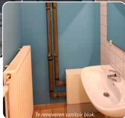
Te renoveren sanitair blok.